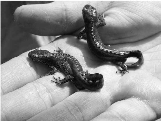
Bildunterschrift: Bergmolch Bilder Fotograf und Copyright Naturpark Altmühltal e. V.

Noch gibt es sie – Gelbbauchunke, Laubfrosch, Springfrosch und Kammmolch konnten im Zuge einer aktuellen Amphibienkartierung des Naturpark Altmühltal e. V. im östlichen Landkreis Donau-Ries nachgewiesen werden. Ein toller Erfolg, vor allem im Hinblick darauf, dass die Bestände seit Jahren stark rückgängig sind. Das liegt nicht zuletzt an dem starken Schwund an Tümpeln, Teichen, Weihern und Kleinstgewässern.